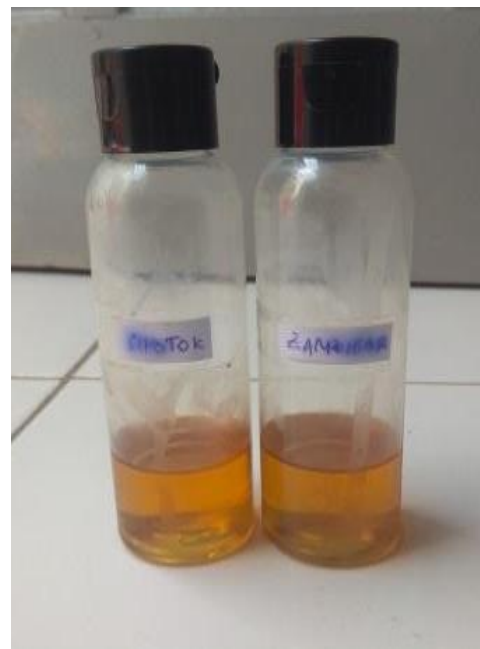
Gambar 3. Minyak atsiri daun cengkeh