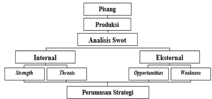
Gambar 1. Kerangka Pemikiran

Analisis SWOT merupakan salah satu metode untuk menganalisis pengembangan suatu strategi usaha tani yang akan dikeluarkan. Dalam analisis SWOT menfokuskan dan menganalisis faktor internal dan faktor external yang mempengaruhi suatu cara pengembangan usaha tani pisang.