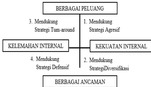
Gambar 2. Diagram SWOT

faktor-faktor internal dan eksternal pada matriks internal, eksternal, dan matriks SWOT.