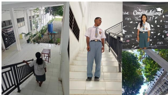
Gambar 3. Hasil Praktik Sesi Ke-2

Siswa mencoba semua jenis camera angle . Hasil praktik siswa dikumpulkan, ditinjau dan dievaluasi bersama untuk memberikan masukan agar siswa dapat menyempurnakan hasil foto secara mandiri. Hasil praktik camera angle terlihat pada gambar 3.