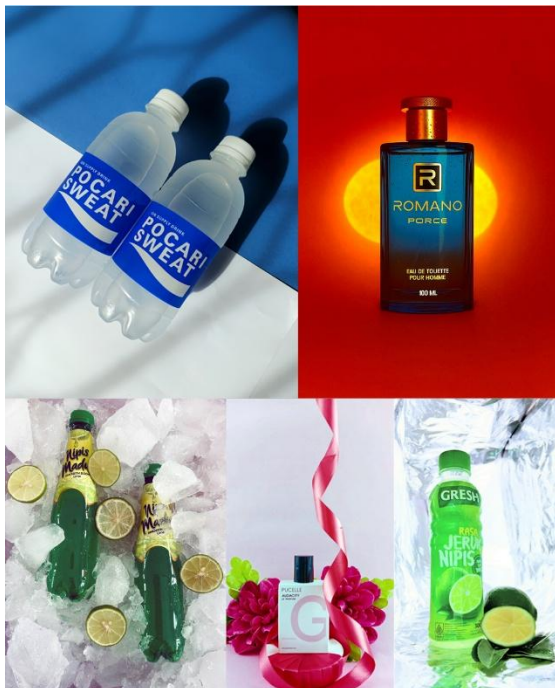
Gambar 9. Praktik Foto Produk Sesi Ke-4

Siswa memperlihatkan kemajuan yang sangat signifikan, di mana siswa secara mandiri mampu menghasilkan foto produk yang lebih beragam dengan komposisi rapi, teknik yang beragam, serta pencahayaan lebih terkendali. Beberapa hasil foto produk siswa dapat dilihat pada gambar 9.