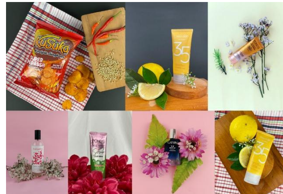
Gambar 7. Hasil Praktik Foto Produk

Sesi praktik foto produk yang telah dilakukan dalam dua kali pertemuan membuat keterampilan fotografi siswa semakin terasah. Hal ini dibuktikan dengan hasil foto produk yang terlihat lebih profesional menggunakan produk dan props yang disediakan oleh instruktur. Beberapa hasil praktik siswa dapat dilihat pada gambar 7.