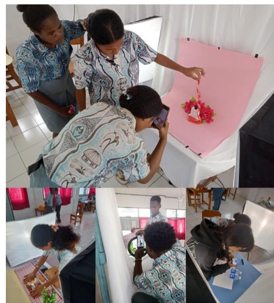
Gambar 8. Praktik Foto Produk Sesi Ke-4

Sesi ke-4 yang merupakan praktik lanjutan fotografi produk, dimana siswa diberikan kebebasan menentukan produk dan props yang dibawa dari rumah masing-masing. Tujuannya adalah untuk menggali sisi kreativitas siswa lebih dalam. Kegiatan fotografi produk diikuti dengan antusias besar, dimana para siswa yang terbagi menjadi enam kelompok membawa beraneka ragam produk dan props yang menarik. Aktivitas pada sesi ke-4 terlihat pada gambar 8.