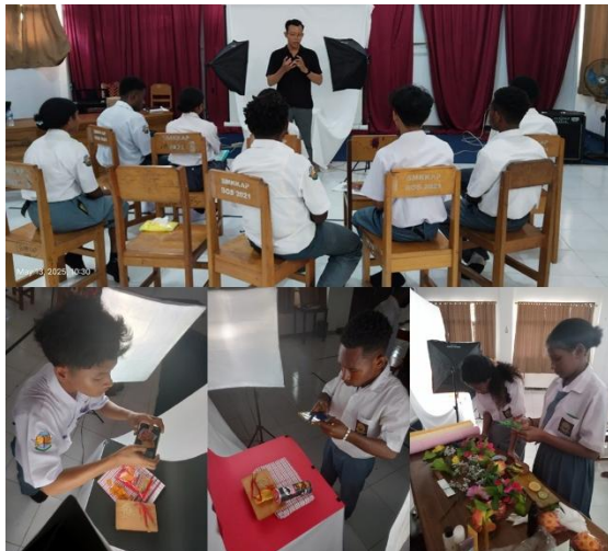
Gambar 5. Praktik Foto Produk Pertemuan Ke-1

Sesi praktik dilanjutkan ke pertemuan ke-2 untuk mengasah kembali kreativitas siswa dalam menata props dan menerapkan teknik-teknik fotografi yang telah diajarkan. Kegiatan praktik foto produk pada pertemuan ke-2 dapat dilihat pada gambar 6.