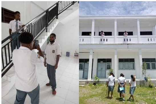
Gambar 2. Praktik Camera Angle

Siswa mencoba semua jenis camera angle . Hasil praktik siswa dikumpulkan, ditinjau dan dievaluasi bersama untuk memberikan masukan agar siswa dapat menyempurnakan hasil foto secara mandiri. Hasil praktik camera angle terlihat pada gambar 3.