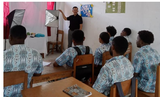
Gambar 4. Pemberian Materi Dasar Foto Produk

pengenalan perangkat studio foto produk. Siswa diajak untuk memahami perbedaan antara foto produk komersial dan kreatif, serta teknik dasar pencahayaan menggunakan sumber cahaya alami maupun buatan, sebagaimana terlihat pada gambar 4.