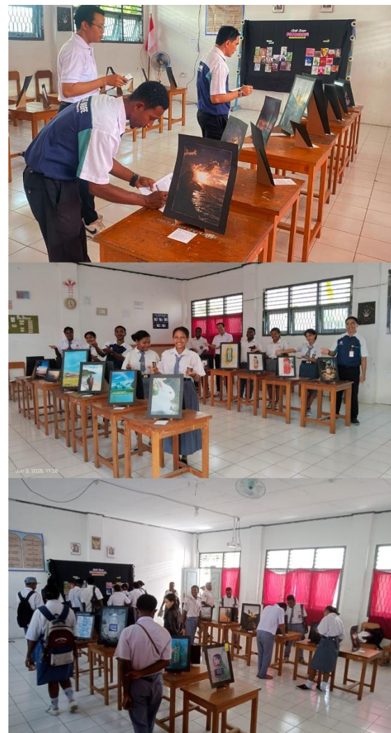
Gambar 10. Penilaian dan Pameran Hasil Karya

Pameran ini tidak hanya menjadi bukti nyata peningkatan kompetensi siswa tetapi juga mendapat apresiasi positif dari guru dan pihak sekolah, yang melihat potensi besar karya-karya tersebut untuk digunakan sebagai portofolio atau konten promosi sekolah. Kegiatan penilaian dan pameran karya dapat dilihat pada gambar 10.