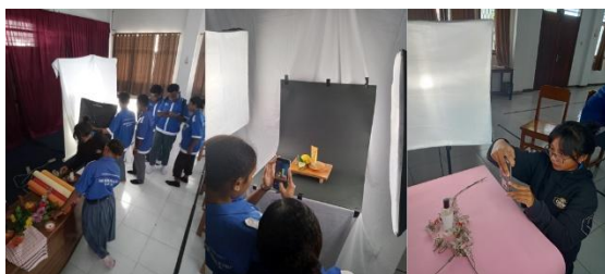
Gambar 6. Praktik Foto Produk Pertemuan Ke-2

Sesi praktik dilanjutkan ke pertemuan ke-2 untuk mengasah kembali kreativitas siswa dalam menata props dan menerapkan teknik-teknik fotografi yang telah diajarkan. Kegiatan praktik foto produk pada pertemuan ke-2 dapat dilihat pada gambar 6.