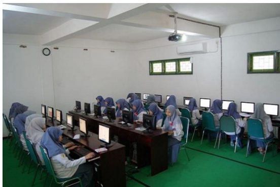
Gambar 5. Suasana Pelatihan di SMK Nurul Jadid