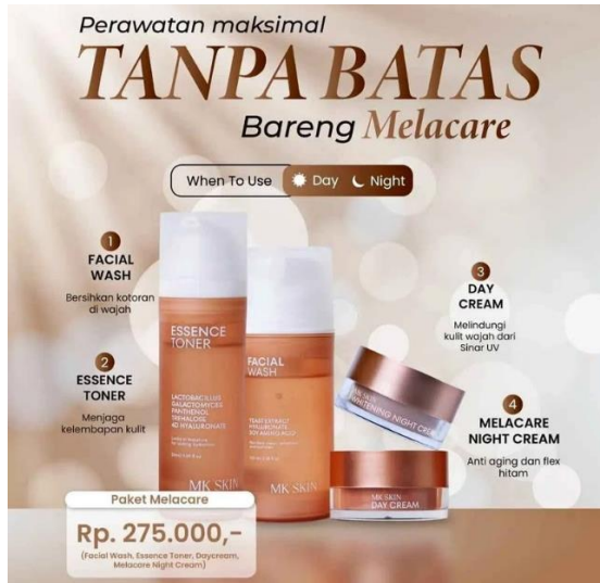
Gambar 3. Hasil pembuatan konten dengan Canva AI oleh Siswa