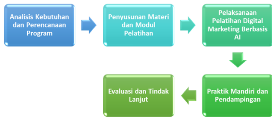
Gambar 1. Alur pelaksanaan kegiatan Pelatihan